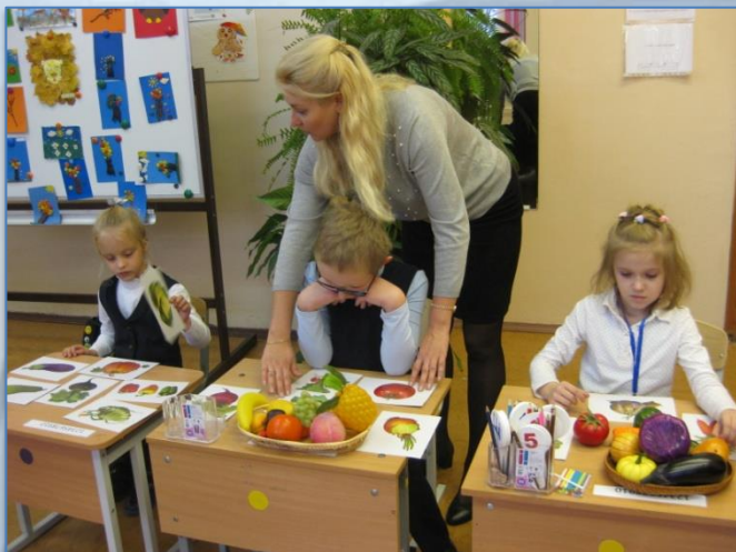
Учитель инклюзивного класса